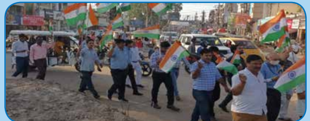
क्षेत्रीय कार्यालय बरेली