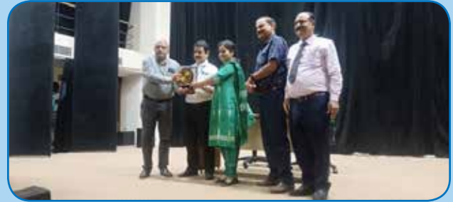
राजभाषा के उत्कृष्ट कार्यान्वयन हेतु नगर राजभाषा कार्यान्वयन समिति जमशेदपुर द्वारा हमारे जमशेदपुर शाखा को तृतीय पुरस्कार प्रदान किया गया.