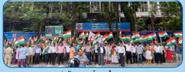
आंचलिक कार्यालय, हैदराबाद