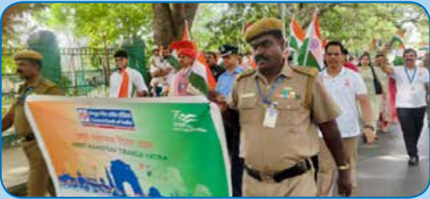
आंचलिक कार्यालय चेन्नई