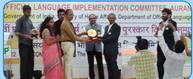
बैंक नगर राजभाषा कार्यान्वयन समिति, औरंगाबाद की अर्द्धवार्षिक बैठक में हमारे बैंक को राजभाषा कार्यान्वयन हेतु तृतीय पुरस्कार से पुरस्कृत किया गया.