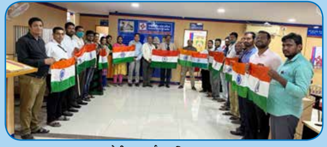
क्षेत्रीय कार्यालय विजयवाड़ा