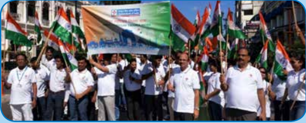
आंचलिक कार्यालय, लखनऊ