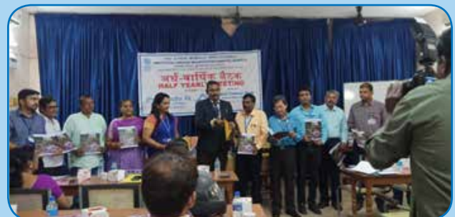
राजभाषा के उत्कृष्ट कार्यान्वयन हेतु नगर राजभाषा कार्यान्वयन समिति नागरकोइल द्वारा सेन्ट्रल बैंक ऑफ इंडिया शाखा नागरकोइल को तृतीय पुरस्कार प्रदान किया गया.