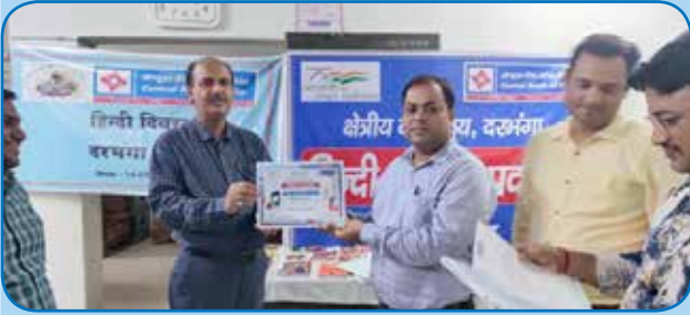
दरभंगा क्षेत्रीय कार्यालय में हिंदी दिवस के अवसर पर विभिन्न कार्यक्रमों का आयोजन किया गया.