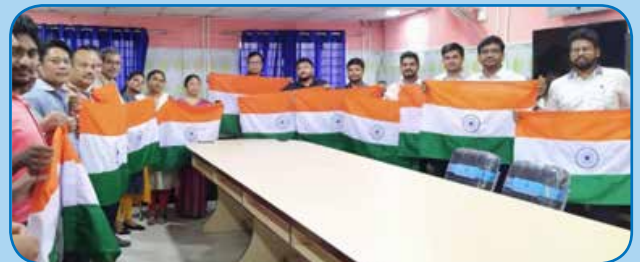
क्षेत्रीय कार्यालय जलपाईगुड़ी