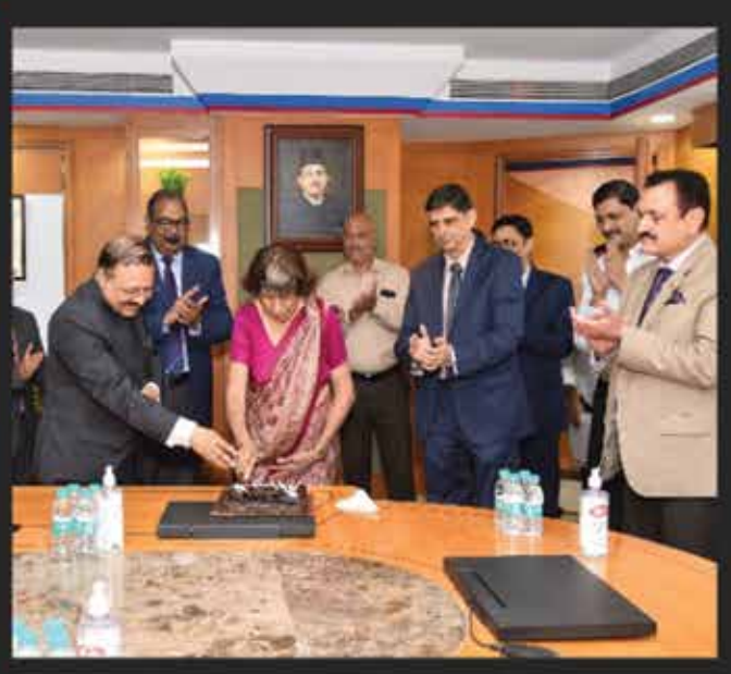
केन्द्रीय कार्यालय में संस्थापक जयंती 09.08.2022