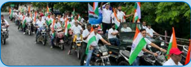
क्षेत्रीय कार्यालय जबलपुर