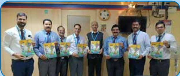
आंचलिक कार्यालय चेन्नई राजभाषा कार्यान्वयन समिति की बैठक में अंचल प्रमुख, उप आंचलिक प्रबंधक एवम सम्मानीय सदस्यों द्वारा अंचल की हिंदी ई पत्रिका *सेंट दक्षिण दर्पण* का विमोचन.