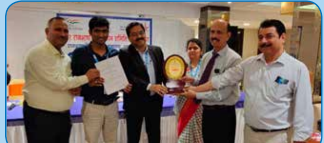
राजभाषा के क्षेत्र में उत्कृष्ट कार्य करने हेतु नराकास मुजफ्फरपुर द्वारा सेन्ट्रल बैंक ऑफ इंडिया, क्षेत्रीय कार्यालय, मुजफ्फरपुर को प्रथम पुरस्कार/शील्ड प्रदान किया गया.