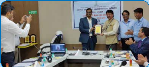
बैंक नगर राजभाषा कार्यान्वयन समिति, सूरत की अर्द्धवार्षिक बैठक में क्षेत्रीय कार्यालय सूरत को राजभाषा कार्यान्वयन हेतु तृतीय पुरस्कार से पुरस्कृत किया गया.