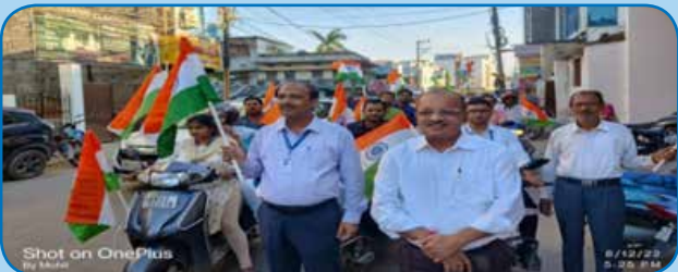
क्षेत्रीय कार्यालय दरभंगा